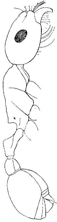
Fig. 22. Pogonomyrme silvestrii ♀.

quasi il margine occipitale. Torace opaco, punteggiato e irregolarmente e sottilmente ruguloso in tutta la sua superficie, meno la faccia declive dell'epinoto che è liscia e lucida; profilo dorsale con leggera impressione nella sutura mesoepinotale; epinoto con denti trigoni, riuniti insieme